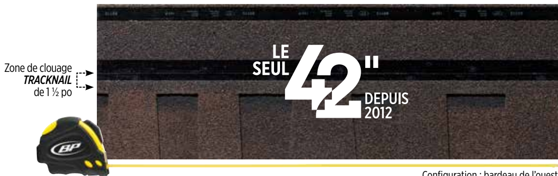
Configuration : bardeau de l'ouest